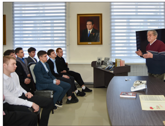
Ветераны Компании поделились воспоминаниями со студентами ЛНТ

«Я из Нурлата, и мне было интересно больше узнать о городе,