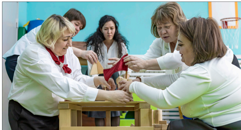
В завершении педсовета педагоги, разделившись на команды, сконструировали макеты детских садов из «Бабашек», опираясь на формы пространственного моделирования

«Мы формируем активного преобразователя пространства. В процессе моделирования в голове воспитанников протекает большое количество мыслительных операций, вырабатываются социальные навыки: ребята учатся избегать конфликтов, договариваются между собой, просят помощи. Важно не угадывать,